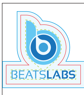
Página 01 Frente/Impressão