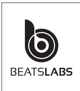
Página 02 Máscara da Tinta Branca