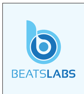
Página 01 Frente/Impressão

Fique sempre atento às margens de segurança do gabarito e evite cortes muito pequenos ou complexos. Para etiquetas simples (Adesivo vinil branco, prata ou transparente), envie apenas duas páginas como mostra abaixo.